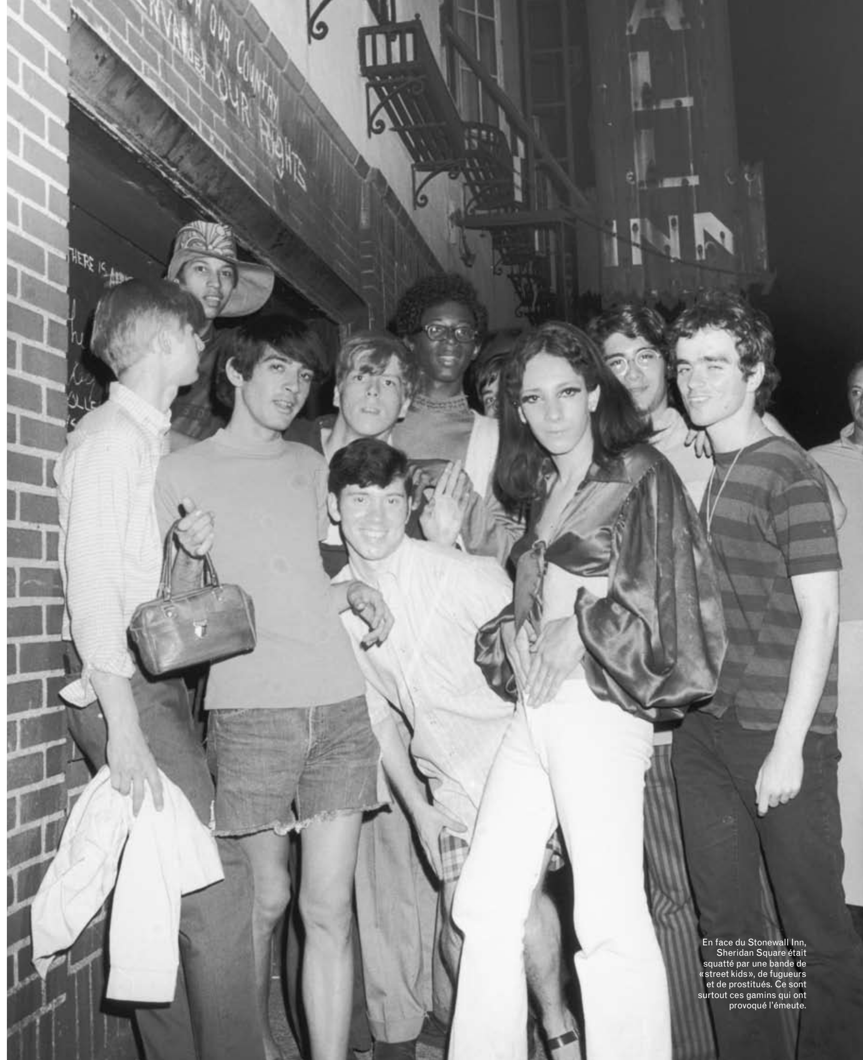
En face du Stonewall Inn, Sheridan Square était squatté par une bande de «street kids», de fugueurs et de prostitués. Ce sont surtout ces gamins qui ont provoqué l'émeute.

Bien que l'un des bars les plus fréquentés, le Stonewall, ouvert en 1966, n'ait pas bonne réputation, même auprès des homosexuels. Ils