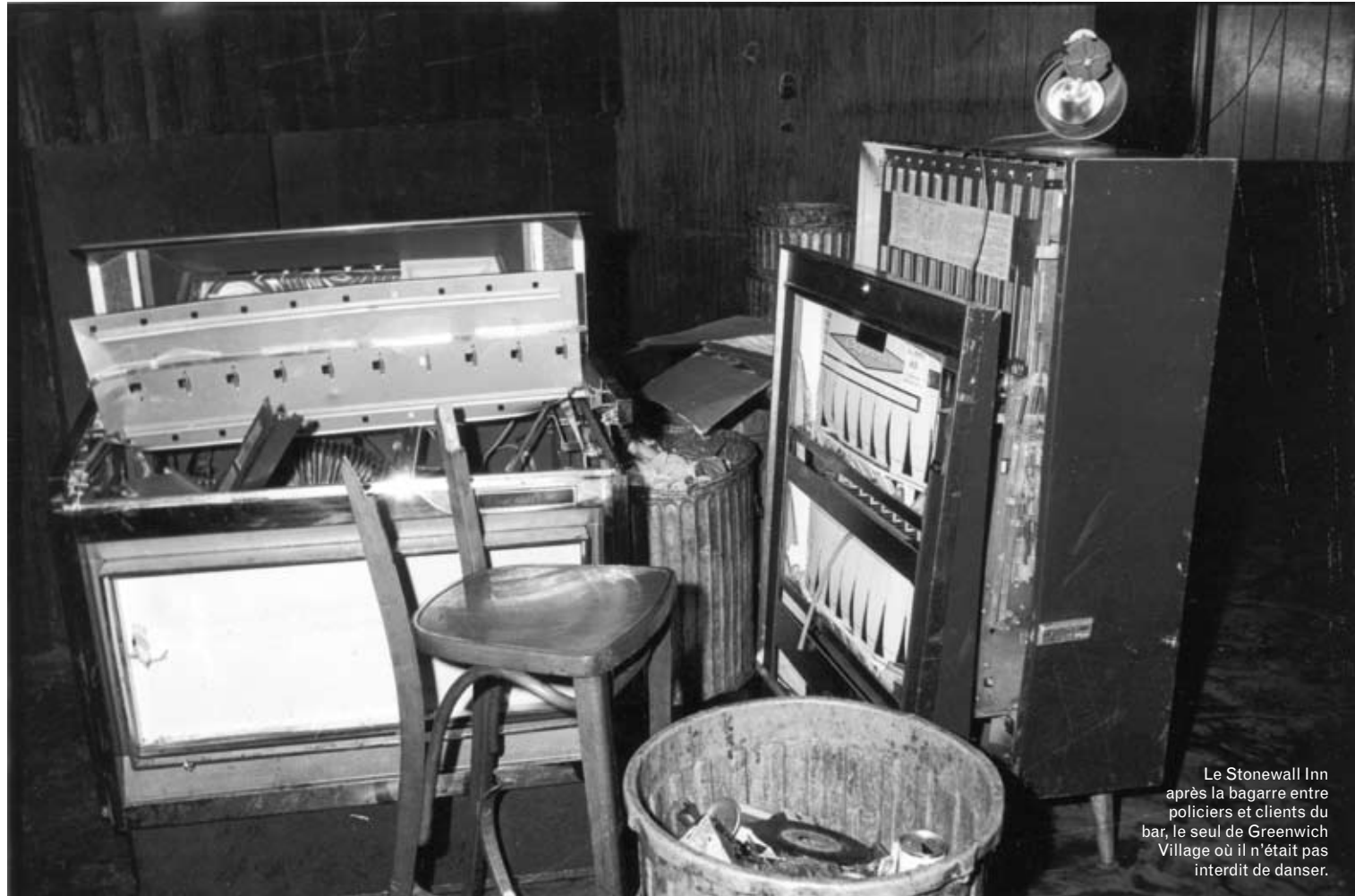
Le Stonewall Inn après la bagarre entre policiers et clients du bar, le seul de Greenwich Village où il n'était pas interdit de danser.